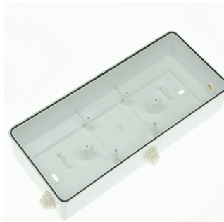
CAJA ESTANCA IP-44 DIANA