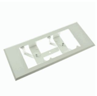
MARCO UNIV DE 8W A DIANA/XENA BLANCO