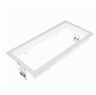
CJTO. ACC. EMP.TECHO XENA FLAT BLANCO