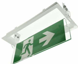
CJTO. BANDEROLA Y MARCO EMPOT XENA FLAT