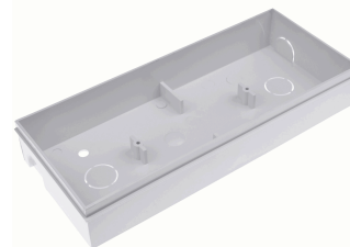
CJTO. ACC. SEMIEMPOTRAR PARED/MURO DIANA