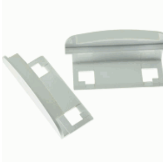
ACCESORIO IK10 DIANA/XENA FLAT DIANA