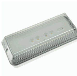
KIT ENVOLVENTE ESTANCO IP-65 DIANA