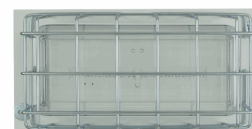
REJILLA DE PROTECCION VENUS